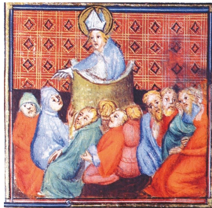
Glaubensvermittlung: Augustinus und seine nordafrikanischen Zuhörer (Ms. 14. Jh., Real Biblioteca del Monasterio de El Escorial)

Blockveranstaltung für Hörer aller Fachbereiche